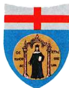
Università degli Studi di Genova